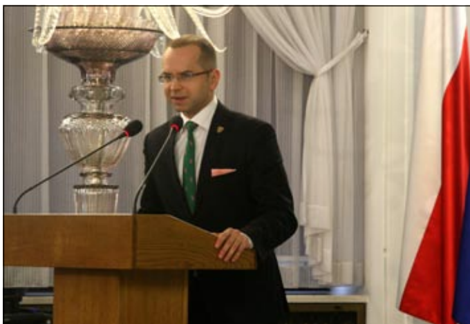
Michał Szczerba, poseł na Sejm RP, Przewodniczący Parlamentarnego Zespołu ds. UTW

Postulat w tym zakresie został zawarty w Deklaracji Końcowej Ogólnopolskiej Konferencji Uniwersytetów Trzeciego Wieku, którą zorganizowało w Sejmie, 16 grudnia 2013 r. Ogólnopolskie Porozumienie UTW przy udziale Parlamentarnego Zespołu ds. UTW i Ministerstwa Pracy i Polityki Społecznej.