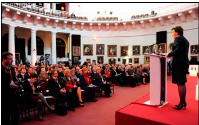
Ewa Kopacz, Marszałek Sejmu RP